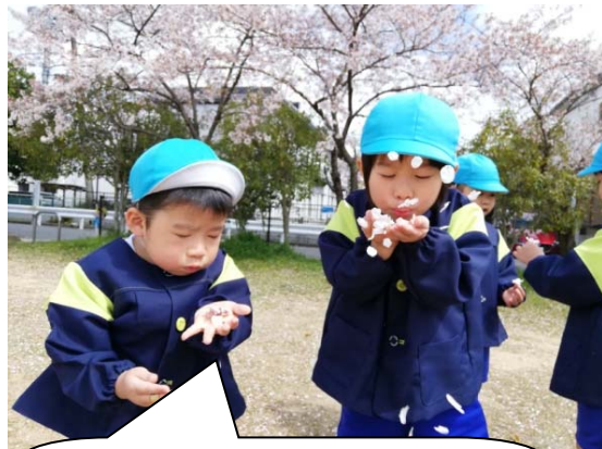
平井公園で桜の花びらを 集めたよ。桜がきれいだったね！