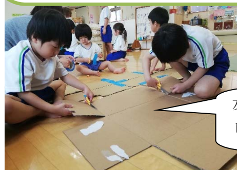
友だちと協力して家づくりを したよ。屋根を作っているよ！