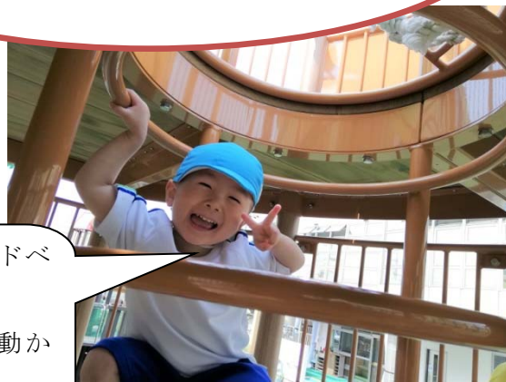
初めて遊んだアドベ ンチャーツリー！ 手と足を交互に動か して登るよ！

はじめて遊ぶ遊具は、ひとつひとつ丁寧に 使い方や約束を確認しながら安全に遊び ました。