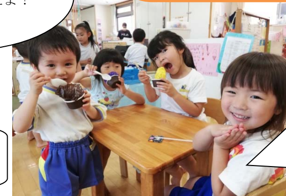
みんなで「どんなお店 屋さんにしようか な？」とアイデアを出 し合ってアイスクリ ーム屋さんを開店！ 友だちと一緒に「いた だきまーす！」。

お部屋の中にある物の色・形探しから様々な 違いに気づいた子どもたち。「あおぐみにいろい ろな形や色のお店屋さんを作りたい！」と みんなで相談してアイスクリーム屋さんを 作ることになりました。「お店屋さんにあるもの は何か？」と Web を広げてみると、レジや 看板などが出てきました。アイスクリームの種類 を色で分けたり、5色スプレーで飾りをつけを したりとイメージを持って遊びを広げました。