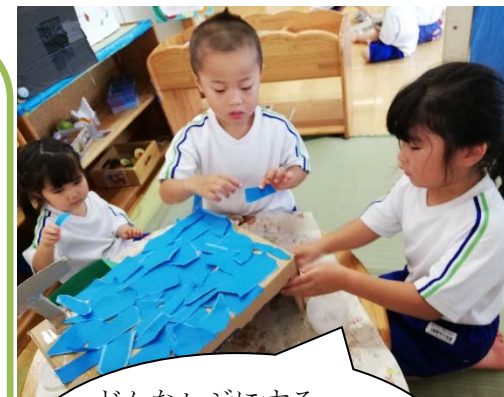
どんなレジにする のかアイデアを 出し合って作ったよ！

5月にはプロジェクトテーマ「いえ」で 屋上から「どんなお家があるのかな？」 「窓や屋根の形が違う！」と気づいたこ とを言葉で伝え、お友だちと一緒に共有 することを楽しみました。 お友だちとたくさんアイデアを出し合 って、みんなで協力してあおぐみの家を 思い思いに表現し作りました。