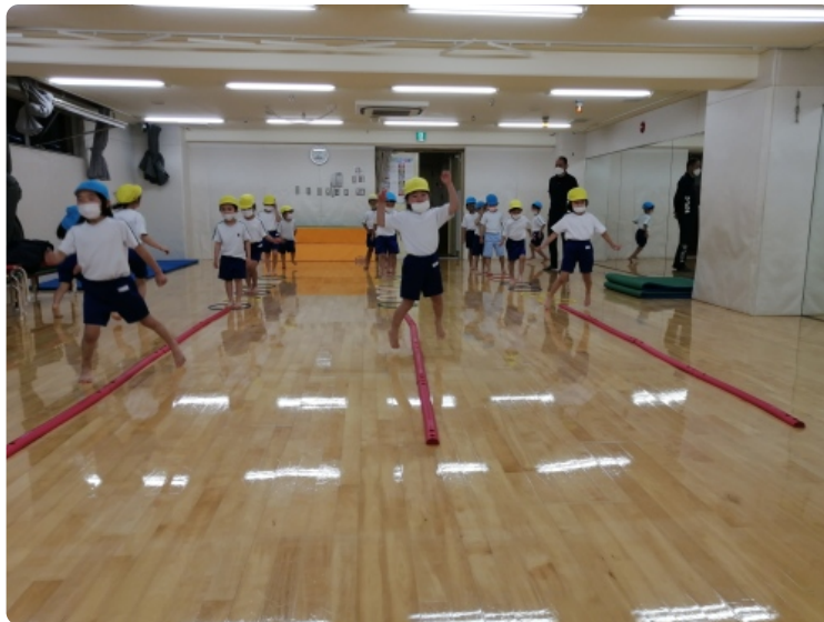
リズムに合わせて体を動かしたよ！