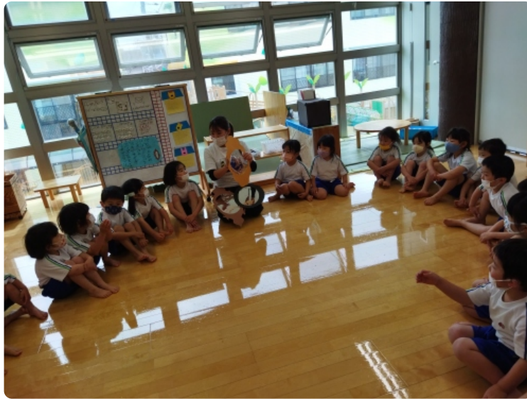
見つけた鏡の中で探している鏡はどれかな？