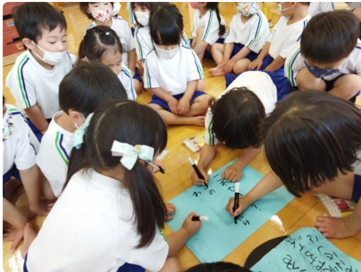
みんなで手紙を書いたよ！