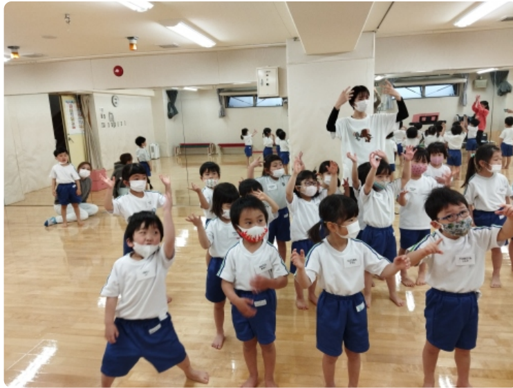
英語でキラキラ星を歌ったよ