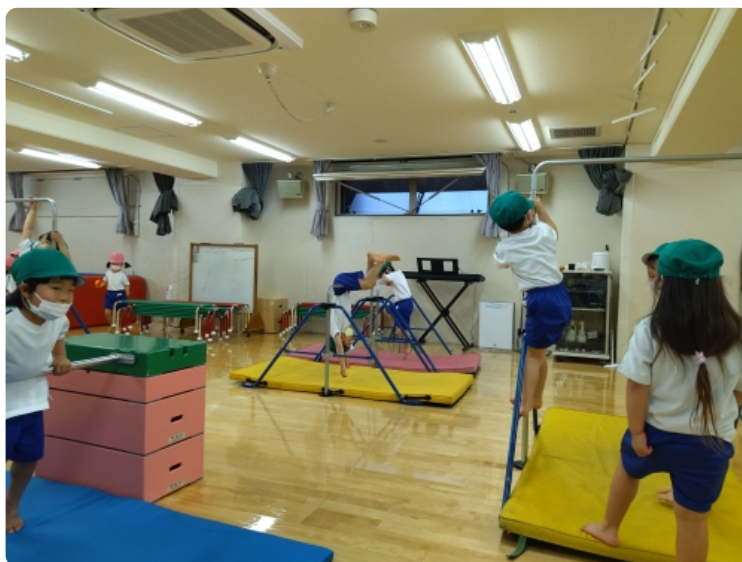
鉄棒をしたよ！まえまわりに挑戦！