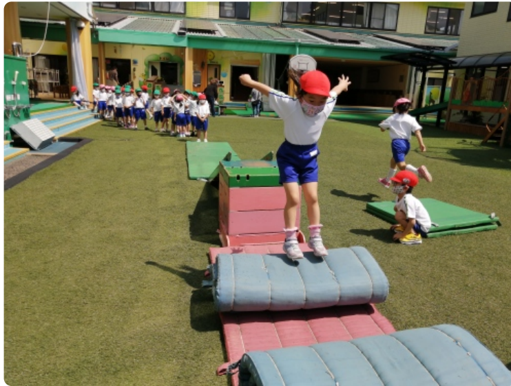
坂に登って高いところからジャンプ！