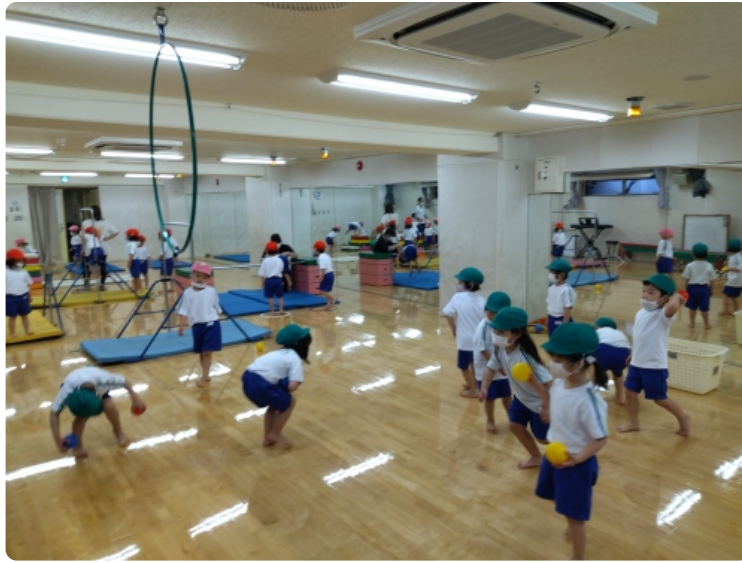
フープを目指してボールを投げよう！