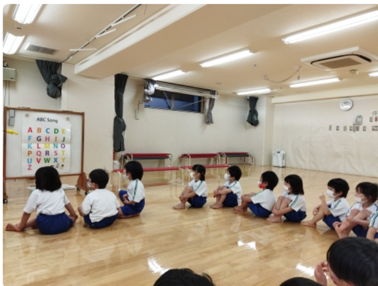
これはAだよ。これはなにかな？