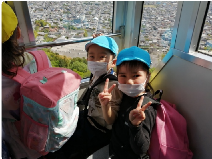
ロープウェイのったよ！