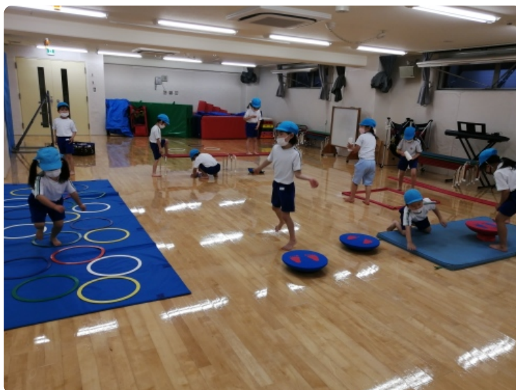
コーナーに分かれて遊んだよ！