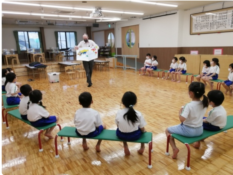
日本とカナダを見つけたよ！