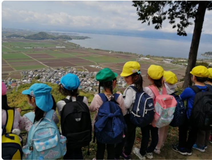
頂上に到着！やっほー！